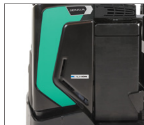
Batería de iones de litio*