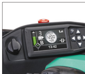
Pantalla multifunción en color

* Consulte disponibilidad en su zona. ** No disponible combinado con cabina para almacenamiento en frío opcional *** No disponible combinado con baterías de iones de litio