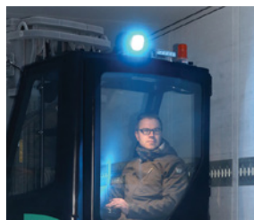
Luz de seguridad con foco azul