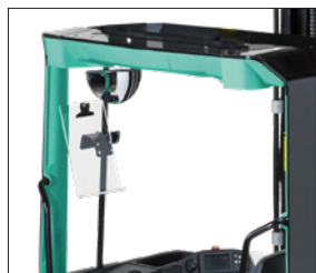
Retrovisor y soporte para listados A4