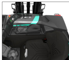
Asiento Grammer con cinturón de seguridad