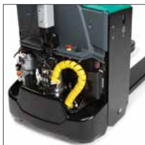
Unidad de transmisión flotante