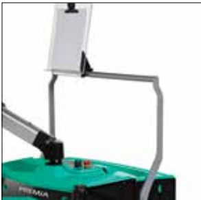
Diseño único de la barra transversal