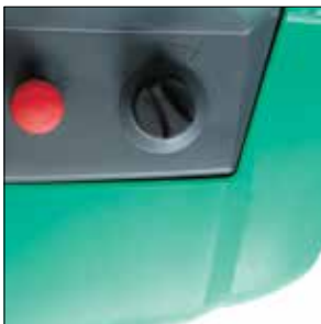
Opciones de modo de funcionamiento