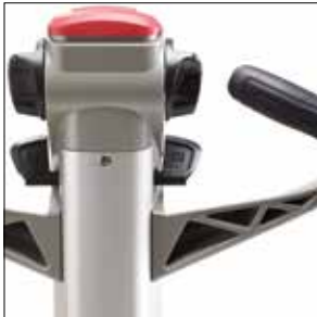
Timón con tecnología avanzada

Transpaletas eléctricas con conductor acompañante y de doble palet 1.6 - 2.0 toneladas