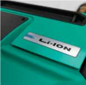
Baterías de alta capacidad