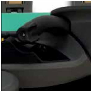
Mango ergonómico con control de velocidad

Transpaleta eléctrica de conductor montado de pie Alimentación AC 2.0 – 3.0 toneladas