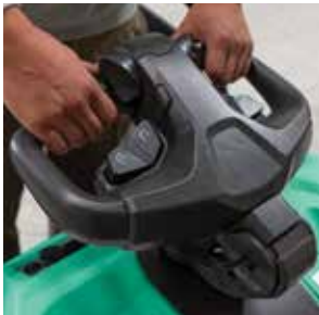
Cabezal del timón ErgoSteer

La gama PREMIA EM está disponible en tres versiones: con plataforma plegable, con plataforma fija de entrada trasera y con plataforma fija de entrada lateral. Cada versión está disponible a su vez con capacidad para 2 o para 2,5 toneladas. Todas las carretillas están provistas de un chasis de alta resistencia en 3 tamaños posibles —mini, junior y senior—, para adaptarse a cualquier tipo de batería. El chasis mini es el más corto del mercado.