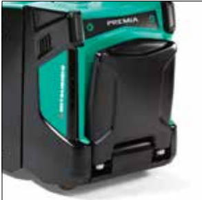
Plataforma plegable (PBP20N2R)