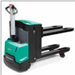
Horquillas elevadoras (PBP20N2E)