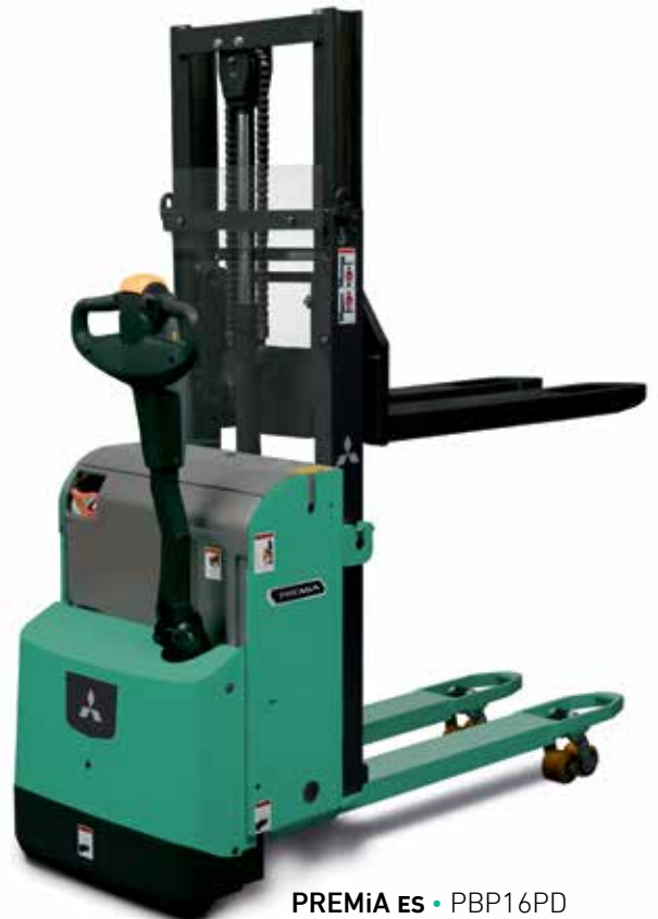
PREMIA ES • PBP16PD

Se instala de serie para proteger la batería y evitar su descarga completa.