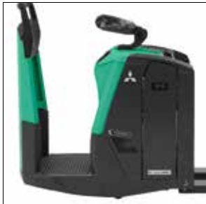
Altura de escalón muy baja