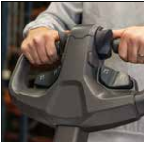
Controles a derecha e izquierda