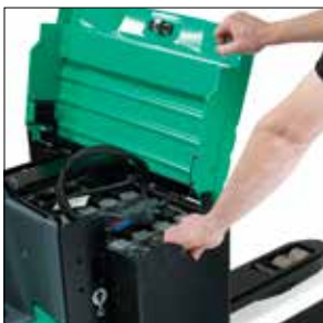
Versátil compartimento de la batería con tapa sin bisagras

Desarrolladas para un rendimiento continuo en los entornos más extremos, las transpaletas eléctricas con conductor acompañante PREMIA ES le ayudan a recorrer la distancia que necesita..