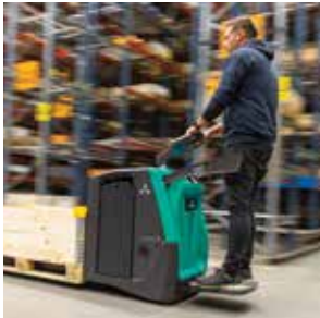
Sistema de estabilidad DriveSteady

Transpaletas eléctricas con plataforma 2.0 - 2.5 toneladas