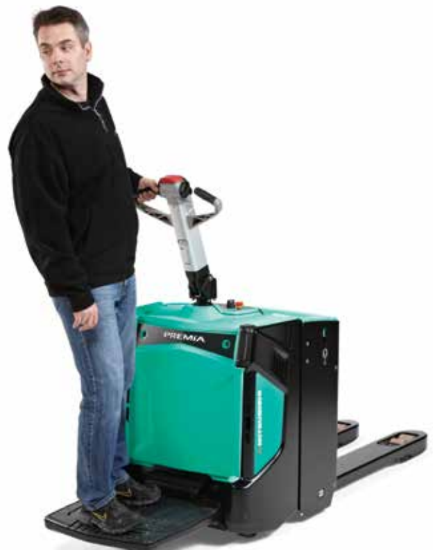
PREMIA ES • PBP20N2R