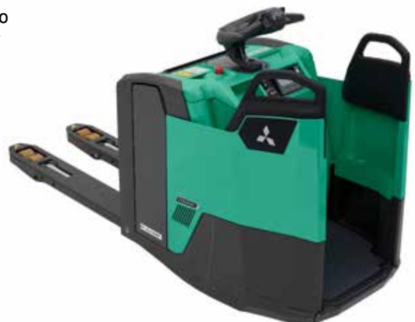
PREMIA EM • PBF20N3R

Se instala de serie para proteger la batería y evitar su descarga completa.