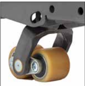
Ruedas de carga protegidas contra el polvo