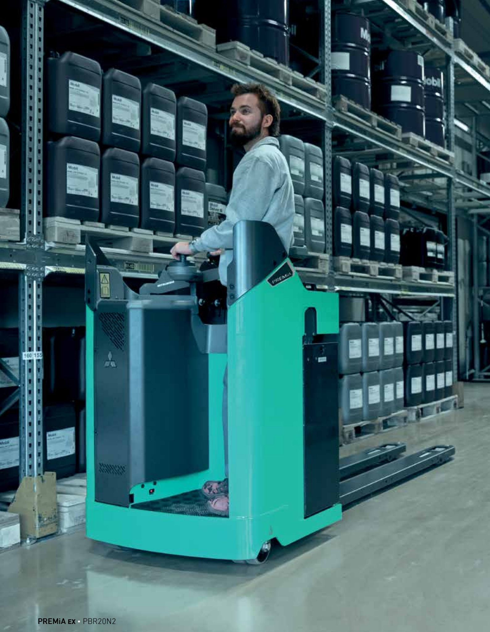
PREMiA EX • PBR20N2