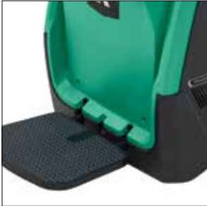
Gran plataforma suspendida

Transpaletas con plataforma para doble palet Alimentación AC 2.0 toneladas