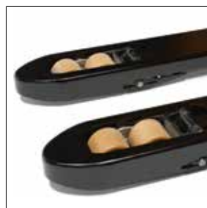
Horquillas cónicas de gran robustez