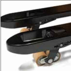
Altura de elevación sin igual en el mercado

Transpaletas eléctricas con conductor acompañante y de doble palet 1.6 -2.0 toneladas