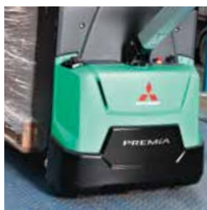
Chasis resistente al agua y al polvo