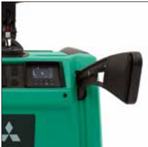
Barras de protección lateral plegables