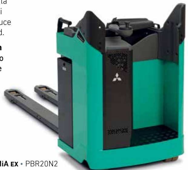
PREMiA EX • PBR20N2