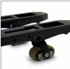
Puntas de horquillas cónicas y en ángulo

Garantice la comodidad y la seguridad de los operarios durante el transporte horizontal en distancias medias y largas con una transpaleta eléctrica de conductor montado de pie. Los controles ergonómicos, el confortable compartimento del operario y la facilidad de acceso y salida eliminan el estrés de las largas jornadas y reducen en gran medida el cansancio del conductor.