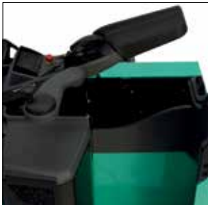
Almacenamiento en el reposabrazos ajustable