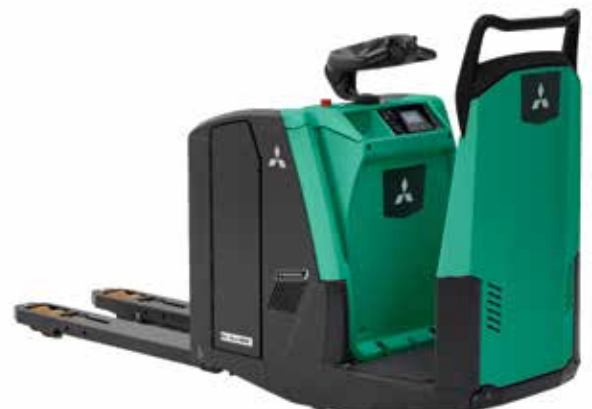
PREMIA EM • PBF20N3S

entre la batería y la carretilla. El nivel de batería, las notificaciones y alarmas están integrados en la pantalla de la carretilla para garantizar una visión general clara y sencilla al operario.