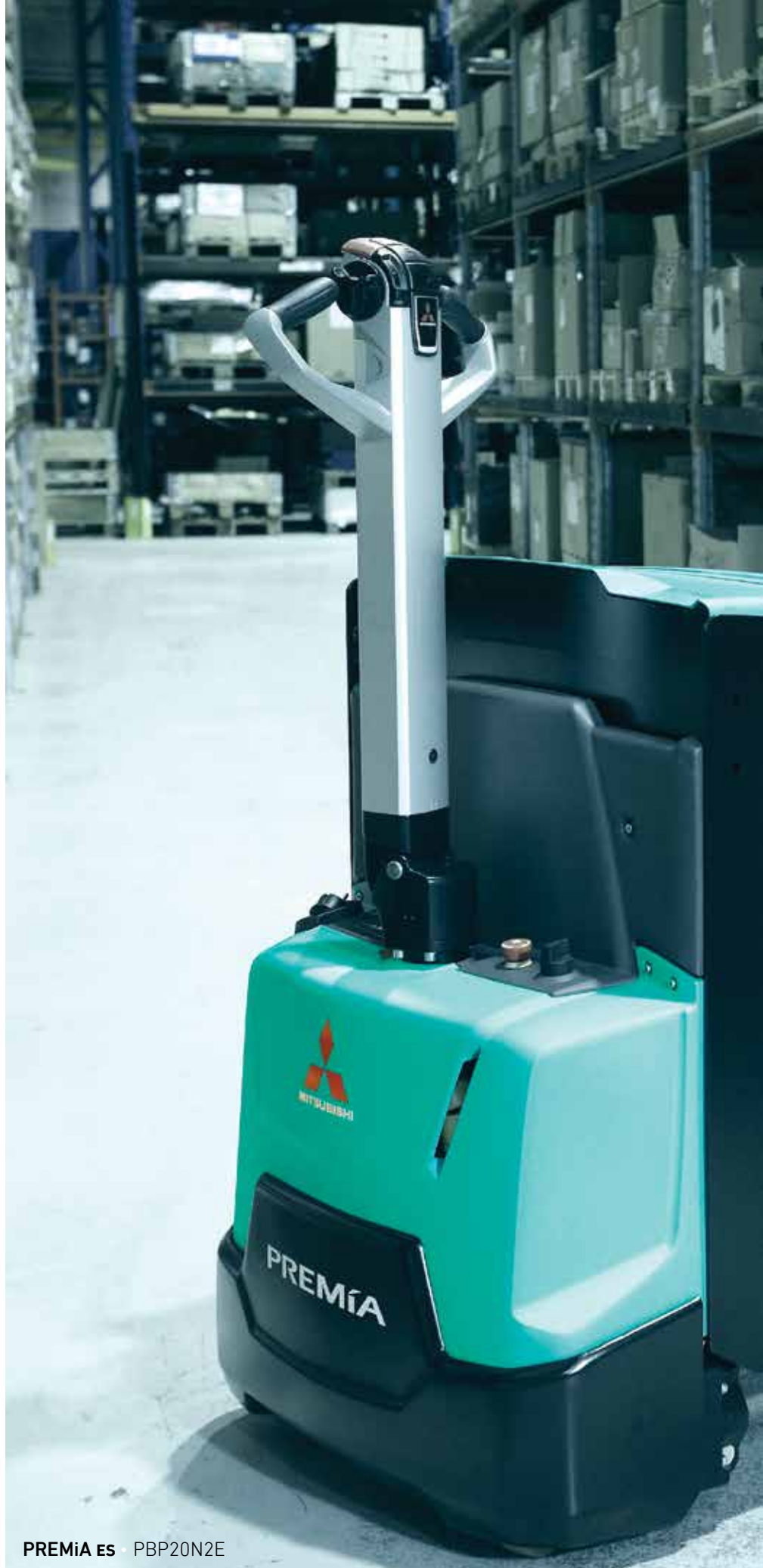
PREMiA ES · PBP20N2E

Un enfoque inteligente elimina el estrés en los turnos de trabajo y aumenta la productividad.