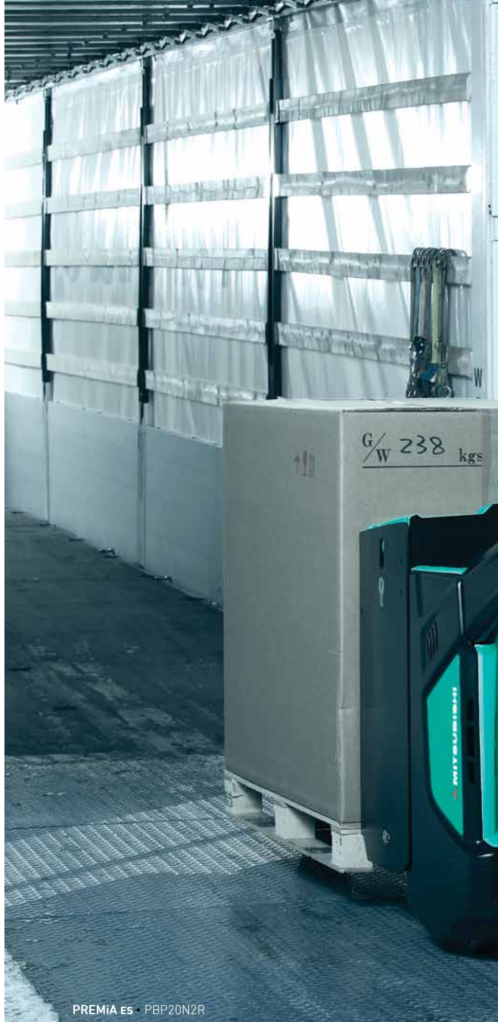
PREMiA ES • PBP20N2R

A los operarios les encanta la PREMiA , y a usted también le convencerá.