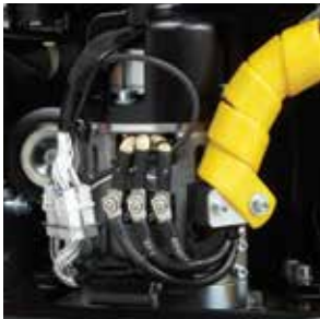
Unidad de transmisión de hierro fundido